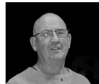
ROBERT CAPLAZI MAXIMUS GAST DER PENSION UND EULENPSYCHOLOGE